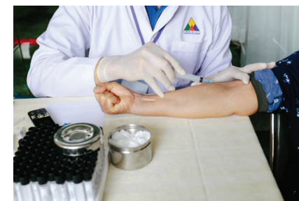
L'accès à la santé: un droit universel